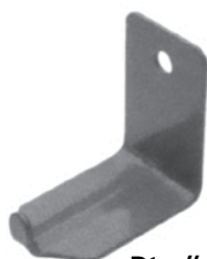
Pt. # 700249