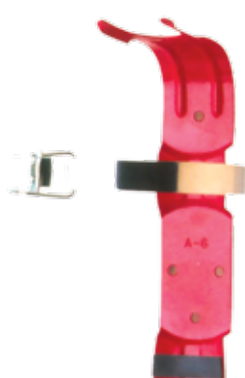
Pt. # 700270