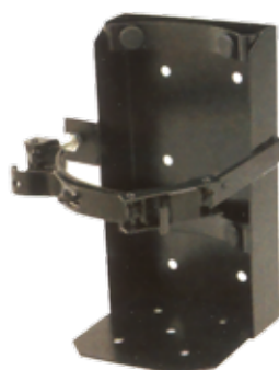
Pt. # 700224