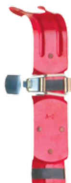
Pt. # 700287

Si usted está buscando uno para su vehículo o barco o simplemente colgarlos en una pared, usted puede estar seguro que todos nuestros soportes y ganchos de pared están diseñadas para mantener su extintor Buckeye seguro y fácilmente accesible.