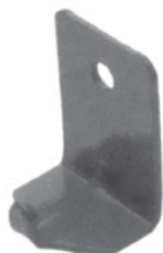
Pt. # 700203