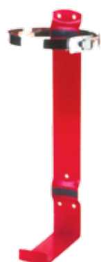
Pt. # 700430