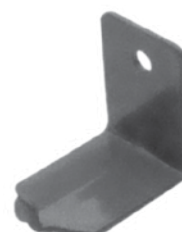
Pt. # 700247