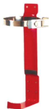
Pt. # 700260